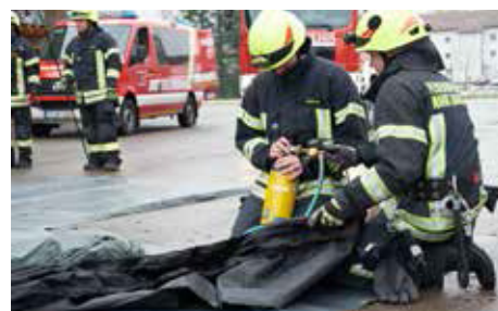
Gonflage en 2 minutes

Raccord d'air comprimé (femelle) : pour tuyau de 9mm de diamètre; largeur nominale de 7,2mm